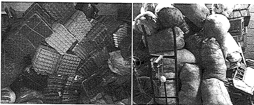
FOTOS: Reciclaje con almacenamiento en vivienda y bodega de particulares en el municipio de Amaga.