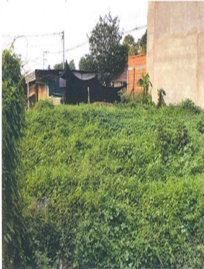
Ilustración 1 evidencia lote del señor Martínez ubicado en la manzana 30, lote 6 en el proyecto denominado el dromedario.